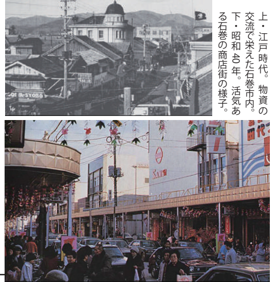
上・江戸時代。物資の交流で栄えた石巻市内。下・昭和5年。活気ある石巻の商店街の様子。