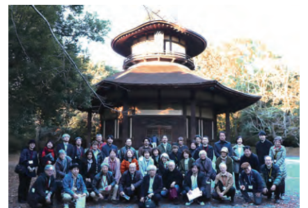
俳聖殿前での集合写真