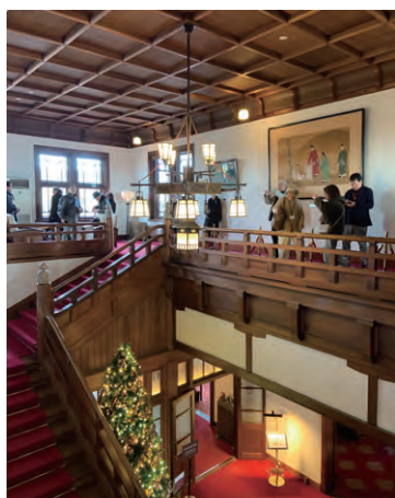
木造によるホテルロビーのスケールコントロール

まって時代を超えて異なるスケールが交錯する感覚。車のスケールを包み込んで人と共存するあり方を見た気がした。寺社建築とは異なる木造の醍醐味を感じられる100年建築。歴史の積み重ねは建築のありようを様々なエピソードとともに手慣れたガイドがユーモアとともにたっぷりと紹介してくれて堪能。