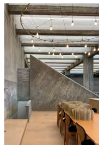
旧上野市庁舎外観(上)と図書館